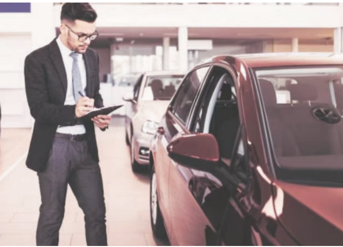
अक्टूबर महीने में यात्री वाहनों की रिकॉर्ड बिक्री दर्ज की गई, जो पिछले साल की इसी अवधि के मुकाबले 0.9 फीसदी की मामूली बढ़ोतरी है

बाजार की अग्रणी मारुति सुजूकी के साथ-साथ टोयोटा किरोस्कर मोटर और रेनो ने अपनी यूवी की घरेलू बिक्री में क्रमशः 19.4 फीसदी, 51.7 फीसदी और 5.75 फीसदी की बढ़ोतरी दर्ज की। यूवी की घरेलू बिक्री में इजाफे के अलावा