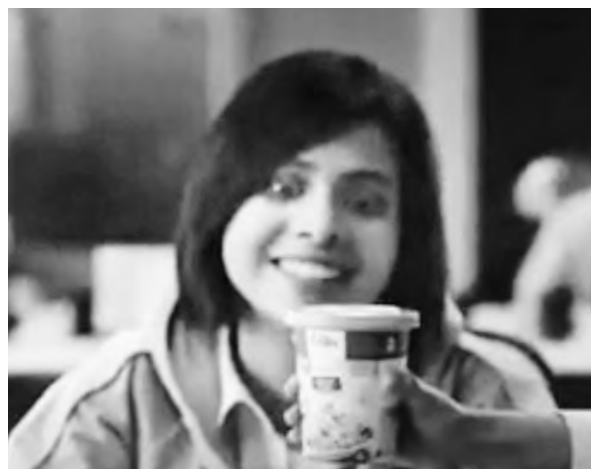
In a new campaign, the company targets working professionals while talking about health and convenience